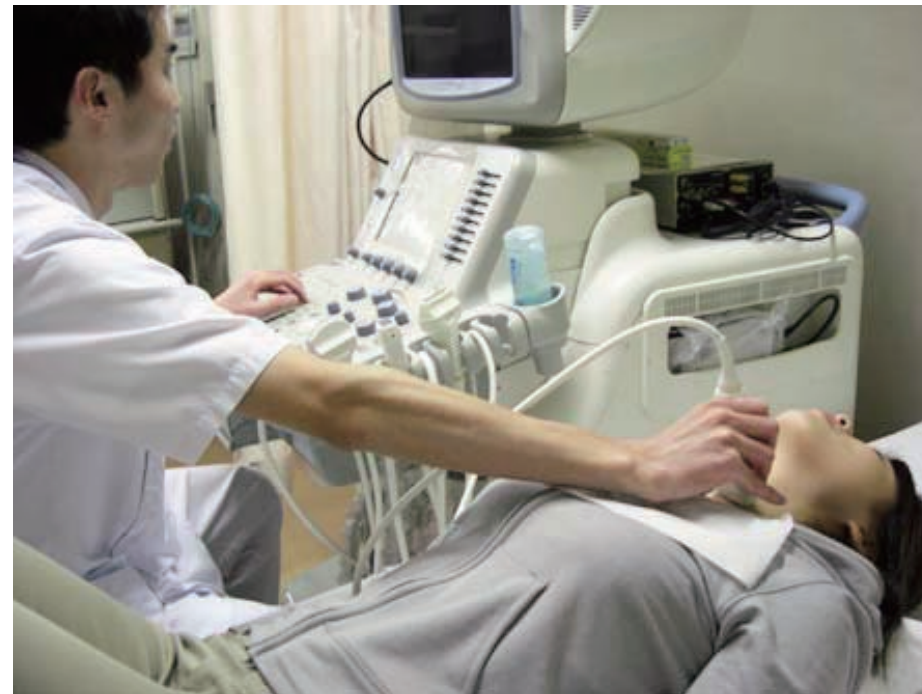
超音波（エコー）検査